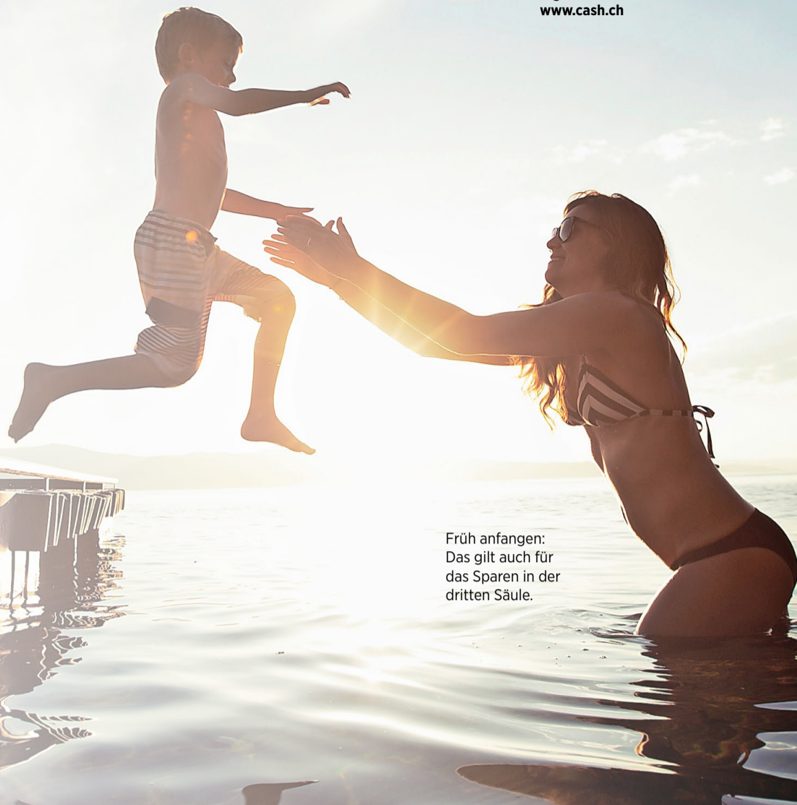
Früh anfangen: Das gilt auch für das Sparen in der dritten Säule.

Bislang können in der Säule 3a Beitragslücken nicht aufgefüllt werden. Wer in einem Kalenderjahr nicht in die Säule 3a eingezahlt hat, kann das im folgenden Jahr nicht mehr nachholen. Ein Systemwechsel könnte das ändern. Der Bundesrat ist derzeit daran, einen Gesetzesartikel zur Änderung der Säule 3a auszuarbeiten. Dadurch sollen Personen mit einem AHV-pflichtigen Einkommen, die in früheren Jahren keine oder nur Teilbeträge in die Säule 3a einzahlen konnten, die Möglichkeit erhalten, dies nachzuholen. Das soll alle fünf Jahre möglich werden. Der Maximalbetrag einer solchen nachträglichen Einzahlung würde bei 34 128 Franken liegen. Dieser Betrag entspricht fast dem Fünffachen des «ordentlichen Beitrags» in der Höhe von 6883 Franken. Diese Nachzahlungen sollen im gleichen Jahr vollumfänglich vom steuerbaren Einkommen abgezogen werden können. Das Gesetz könnte allerdings frühestens 2023/2024 in Kraft treten, sofern es kein Referendum geben wird.